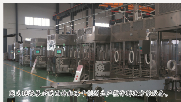
图为现场展示的西林瓶冻干制剂生产整体解决方案设备。